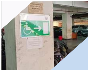
Tanda jalur untuk disabilitas