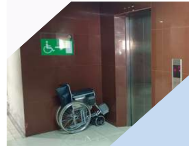
Fasilitas kursi roda untuk disabilitas

BAPETEN terus berupaya meningkatkan aksesibilitas layanan informasi publik bagi penyandang disabilitas sebagai bagian dari komitmen dalam mewujudkan keterbukaan informasi publik yang inklusif. Dalam mendukung pemenuhan hak akses tersebut, BAPETEN telah menyediakan sejumlah fasilitas pendukung di area layanan informasi publik, antara lain kursi roda, jalur landai (ramp) bagi pengguna kursi roda, serta jalur masuk khusus yang memungkinkan penyandang disabilitas mengakses meja layanan informasi secara mandiri, aman, dan nyaman.