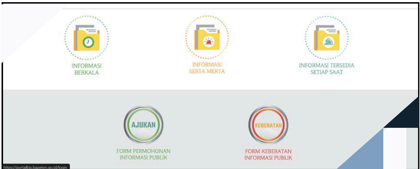
LAYANAN DI PORTAL PPID

Untuk mendukung keterbukaan informasi publik, BAPETEN menyediakan akses informasi melalui berbagai kanal resmi, antara lain portal utama BAPETEN dan laman website PPID BAPETEN. Melalui kanal tersebut, masyarakat dapat memperoleh informasi mengenai Peraturan perundang-undangan dan kebijakan di bidang pengawasan tenaga nuklir, Informasi perizinan pemanfaatan tenaga nuklir. BAPETEN juga memanfaatkan media sosial, serta forum komunikasi dengan para pemangku kepentingan guna memperluas jangkauan informasi dan meningkatkan interaksi dengan masyarakat.